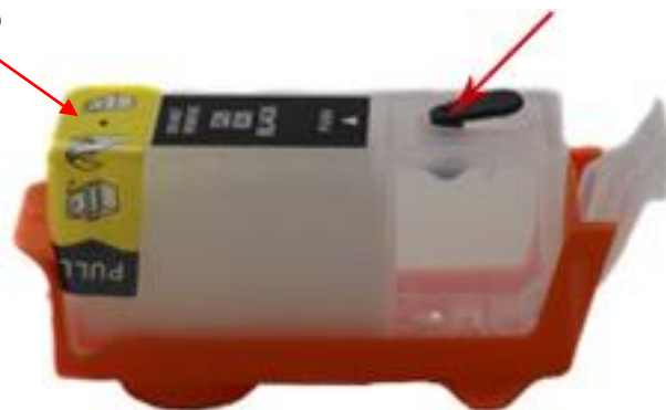
Pusty kartridż napełnialny